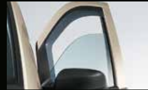
Seitenfenster-Windabweiser, 2-teilig, schützt vor Wind und Wasser, für V-Klasse/EQV und Vito/eVito A 447 766 2500