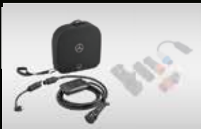
Flexibles Ladesystem für Elektrofahrzeuge A 000 906 6412

Mehr Mercedes-Benz. Original-Zubehör & Collection.