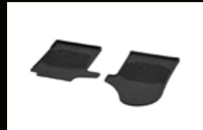
Allwettermatten Fahrer-/ Beifahrermatte A 4476 805 1059 G33