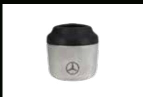
Isotherm-Lunchbox B 669 597 03