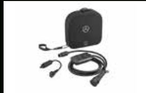
Flexibles Ladesystem Pro A 000 343 6300