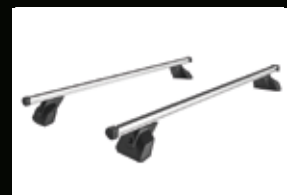
Dachgrundträger, zwei Querbrücken A 420 890 0800