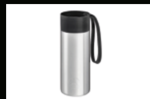
To Go Cup B 669 550 14